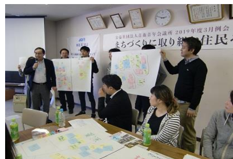
各グループとも内容の濃い発表となり、聞き手も真剣に聞き入っています。