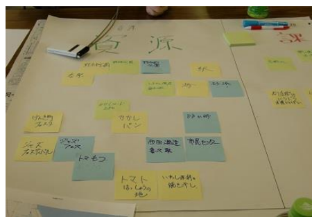
グループごとに油川の資源、地域の課題を意見を出し合い青年会議所のメンバーが付箋にキーワードを書込み貼りつけていきました。発表時間になると我先に発表したいと挙手合戦となりました。